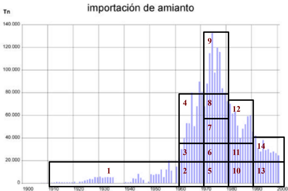
Gráfico nº 1. Importación (consumo) de amianto en España en el siglo XX

(Fuente para la importación: Informe de la Fundación para la prevención de riesgos laborales. Dic. de 2001. Nota: cada cuadro numerado supone la misma cantidad de Tn importadas, unas 185.714)